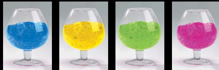
saphir gold apple rosé