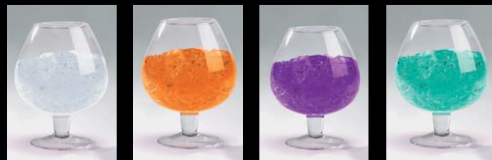
cristal orange amethyst emerald